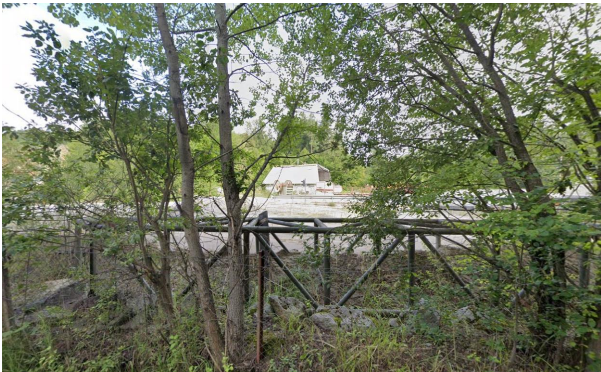
Območje kamnoloma Predstruge.