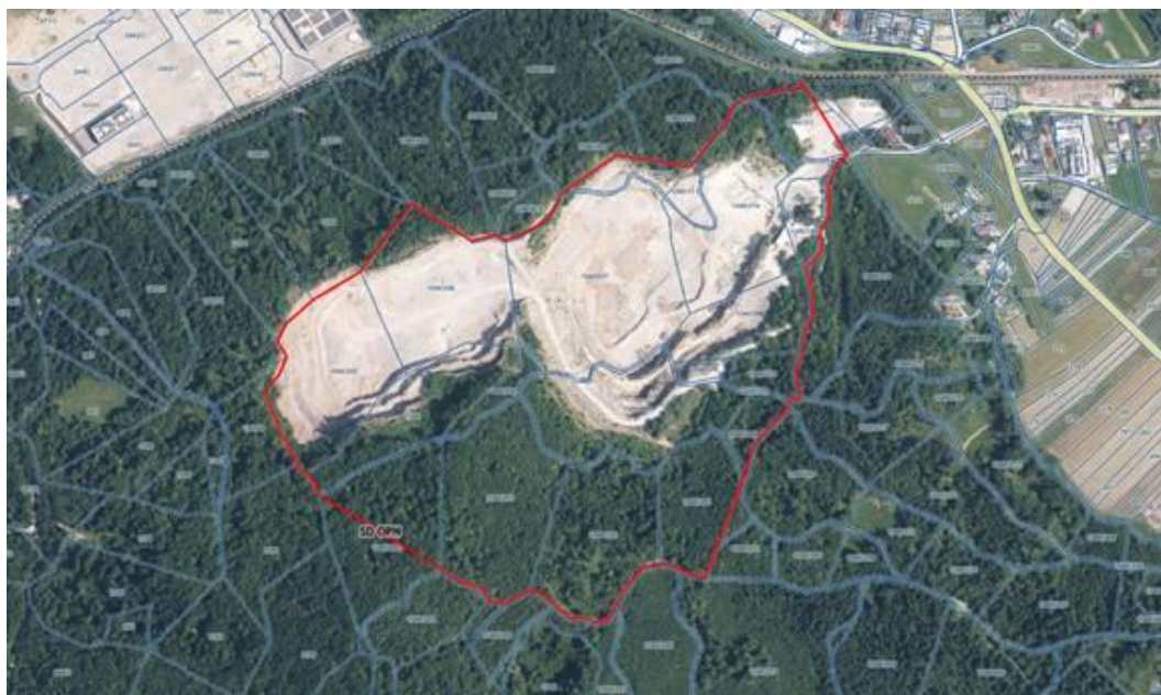
Parcelacija na območju SD OPN.

Okvirno območje SD OPN zajema obstoječ kamnolom z namensko rabo ZS ter širitev na gozdna zemljišča in obsega zemljišča s parc. št. 1048/290, 1048/293, 1048/328, 1048/285, 1048/297, 1048/325, 1048/379, 1048/294, 1048/311, 1048/296, 1048/314, 1048/329, 1048/315, 1048/317, 1048/322, 1048/284, 1048/292, 1048/313, 1048/316, 1048/326, 1048/291, 1048/295, 1048/366, 1044 in 1048/376, vse k.o. 1799-VIDEM DOBREPOLJE, v skupni velikosti 258,379 m 2 .