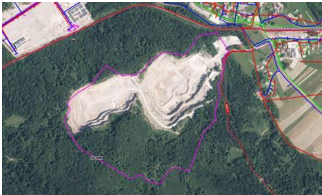
Infrastruktura na območju SD OPN in širše.

Dostop na območje kamnoloma je zagotovljen prek javne poti JP 565171 Predstruge (647-kamn.), ki se priključuje na regionalno cesto R3 647/1368 Mlačevo-Rašica. Ob koncu stacionaže javne poti se proti kamnolomu in vzhodno od njega nadaljuje kategorizirana gozdna cesta Retje – Predstruge.