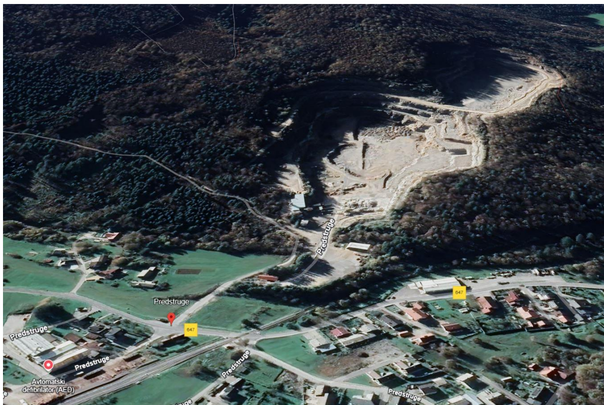
Pogled na kamnolom Predstruge.