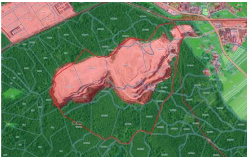
Dejanska raba na območju SD OPN.

Zemljišča se po rabi zemljišča v naravi, na območju kamnoloma, uvrščajo med neplodna zemljišča oz. med zemljišča z nedoločeno rabo, na območju poraslem z gozdom pa med gozdna zemljišča. Dejanska raba na območju obstoječega kamnoloma je pozidano in sorodno zemljišče (ID 3000), na območju gozdnih zemljišč pa gozd (ID 2000).