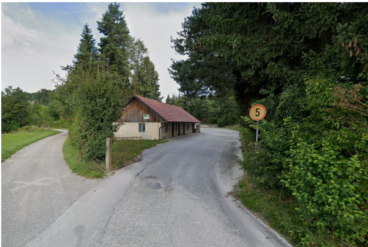
Dostopna cesta v kamnolom Predstruge.