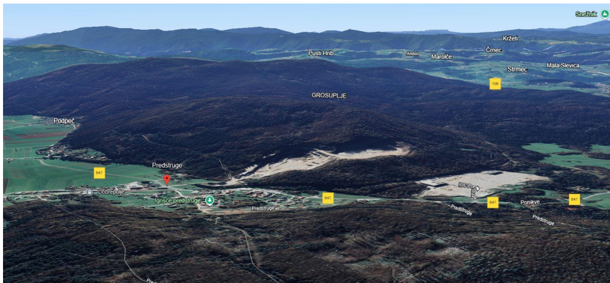
Pogled na območje kamnoloma v širšem prostoru.