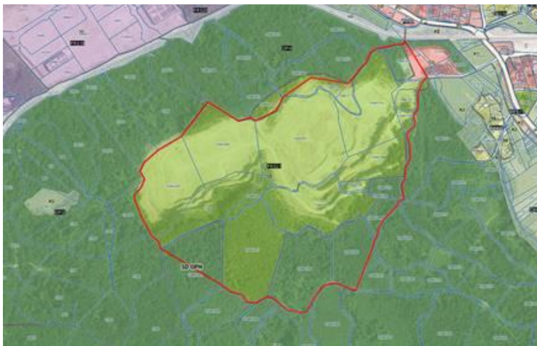
Namenska raba na območju SD OPN.

OPN za območje kamnoloma Predstruge določa enoto urejanja prostora EUP PRS21 Kamnolom Predstruge, z namensko rabo ZS - površine za oddih, rekreacijo in šport. OPN na območju kamnoloma Predstruge določa pripravo občinskega podrobnega prostorskega načrta (v nadaljevanju: OPPN).