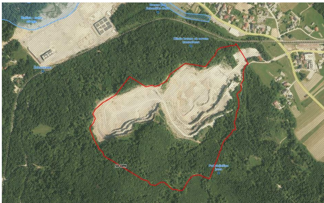
Varstvo narave na območju SD OPN in širše.

Območje SD OPN ne posega na območje varstva kulturne dediščine.